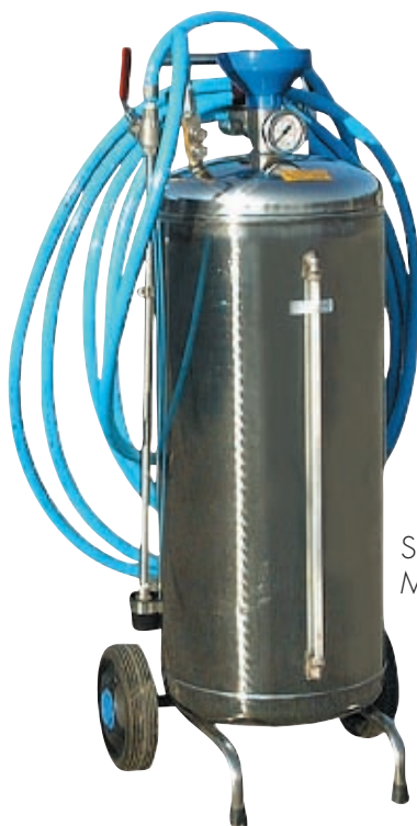
Série ÉCO M50V GD