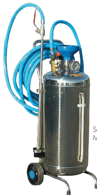
Série ÉCO M24V GD