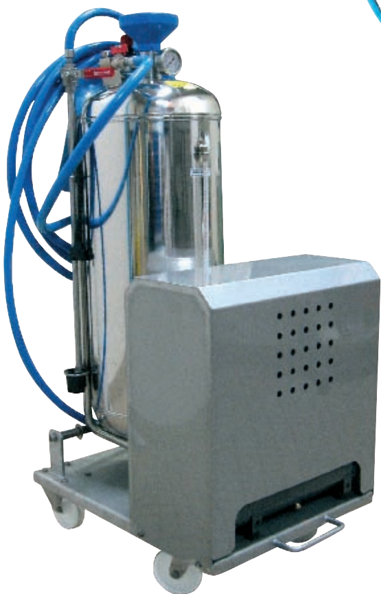
Automousse AM50 V GD