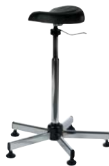
> multi selle