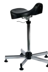
> multi mirsel