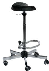
> multi rp selle