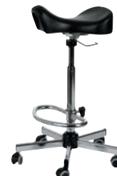
> multi rp mirsel