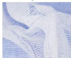
Compresse 40 x 40 cm