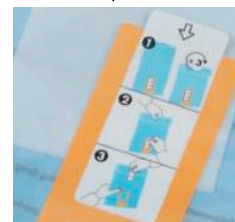
Étiquette de refermeture