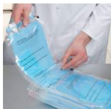
Pack de 20 pièces