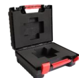
Valise plastique Plastic case