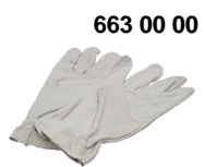
663 00 00 Gants cuir Leather gloves

EMT : Erreurs Maximales Tolérées - MPE : Maximum Permissible Errors Dimensions en mm - Dimensions in mm