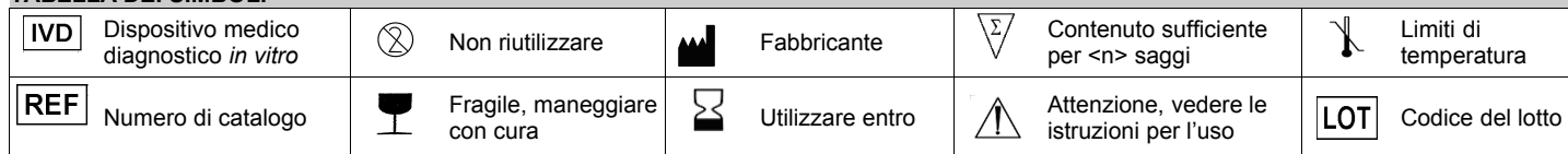
TABELLA DEI SIMBOLI

Un flacone serve per preparare 500 mL di terreno.