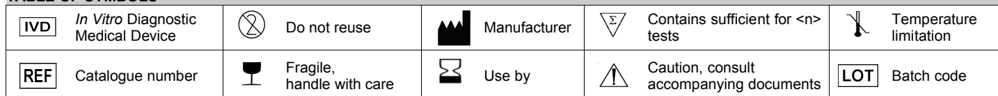
TABLE OF SYMBOLS

One vial is sufficient to prepare 500 mL of medium