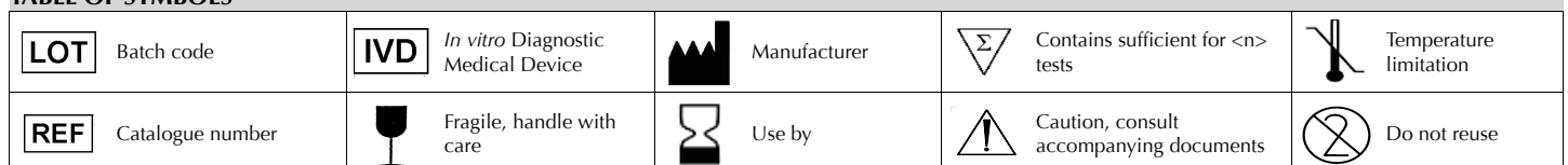
TABLE OF SYMBOLS

One vial is sufficient to prepare 500 ml of medium.