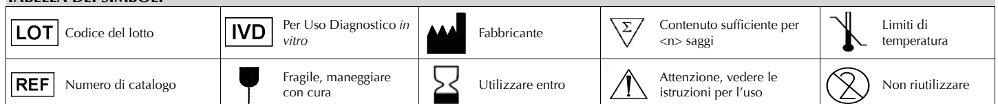
TABELLA DEI SIMBOLI

Una fiala serve per preparare 500 ml di terreno.