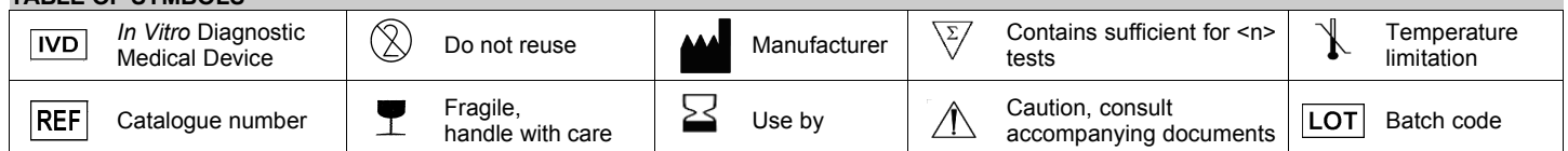
TABLE OF SYMBOLS

One vial is sufficient to prepare 500 mL of medium