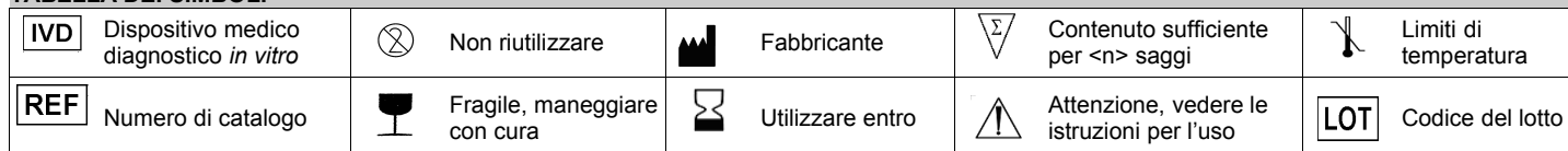
TABELLA DEI SIMBOLI

Un flacone serve per preparare 500 mL di terreno.