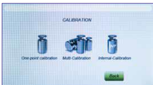
Menu de calibration.