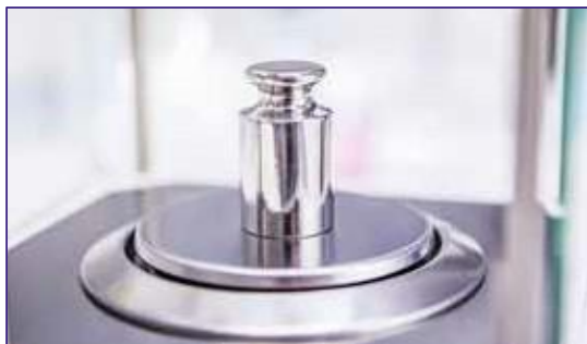
Fournie avec une masse d'échantillon (classe de précision E2) pour les tests et la calibration.