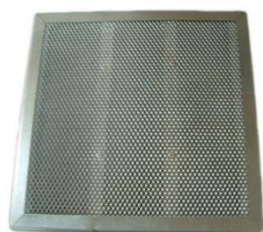
Filtre à charbon actif blend FCP1 Blend