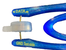
PINCE DE LECTURE

Vos IBees peuvent être lus et programmés avec les logiciels Thermotrack (PC, Online, Webservice) grâce à la pince de lecture et son adaptateur USB