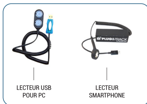
LECTEUR USB POUR PC