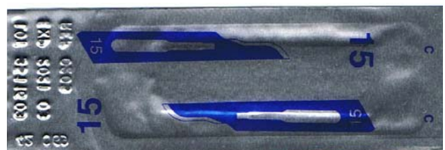
* Référence sur sachet unitaire