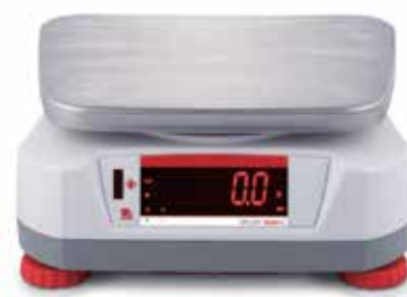
Afficheur arrière avec capteur sans contact intégré