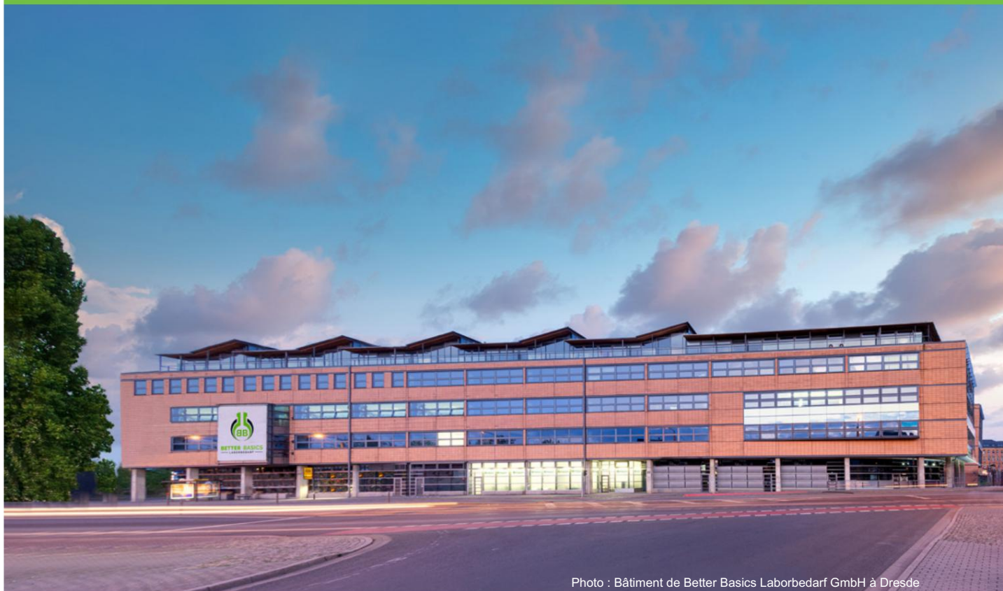
Photo : Bâtiment de Better Basics Laborbedarf GmbH à Dresde