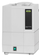
Vacuum Pump V-100 La source d'aspiration économique