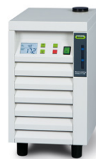
Recirculating Chiller F-100 / F-105 La méthode de refroidissement la plus simple