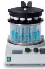
Multivapor™ P-6 / P-12 Évaporation efficace pour plusieurs échantillons