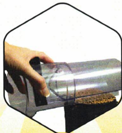
3. Araser la cellule de mesure