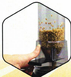
2. Remplir la cellule de mesure