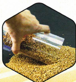
1. Remplir la trémie