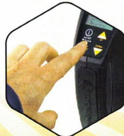
4. Appuyer sur la touche, résultats en quelques secondes