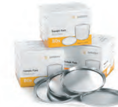
Coupelles à usage unique