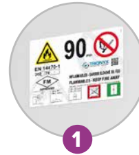
1 Pictogramme normalisé