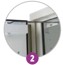
2 Ferme-porte avec thermofusible