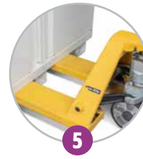
5 Déplacement par transpalette (à vide)