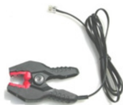
PINCE DE LECTURE

Vos IBees peuvent être lus et programmés avec les logiciels Thermotrack (PC, Online, Webservice) grâce à la pince de lecture et son adaptateur USB