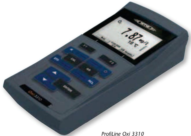
ProfiLine Oxi 3310

Le modèle Oxi 3210 est un appareil de mesure de l'oxygène dissous portable haut de gamme, doté d'une interface utilisateur conviviale et moderne. Les résultats sont indiqués sous forme de concentration, de saturation ou de pression partielle, avec possibilité de mise en mémoire manuelle et d'affichage de valeurs.