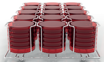
1/2 plateau pour 90 boîtes 90mm