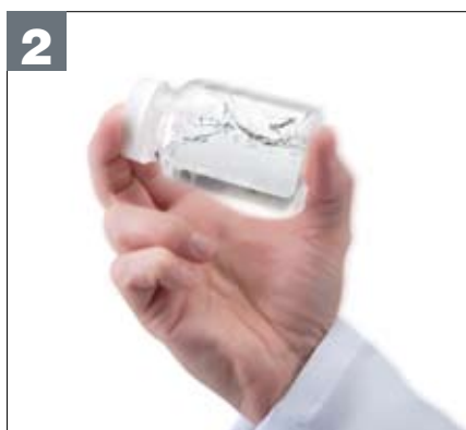
2 Fermer le récipient et agiter pour mélanger