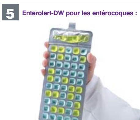
5 Enterolert-DW pour les entérocoques :

Compter les puits positifs et se référer au tableau NPP.