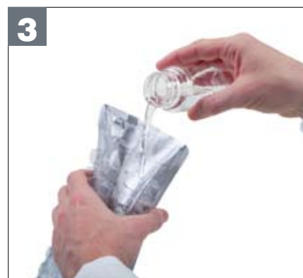
3 Verser le mélange échantillon-réactif dans un plateau