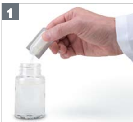
1 Ajouter le réactif à l'échantillon