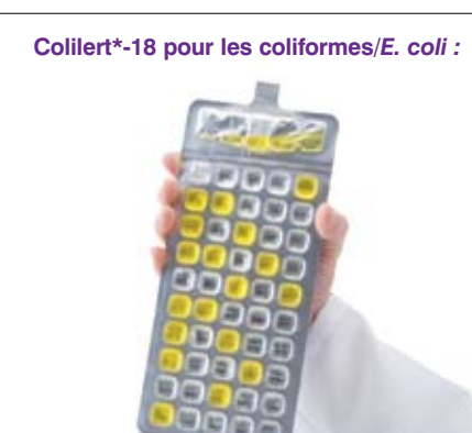
Colilert*-18 pour les coliformes/ E. coli :

Compter les puits positifs et se référer au tableau NPP.