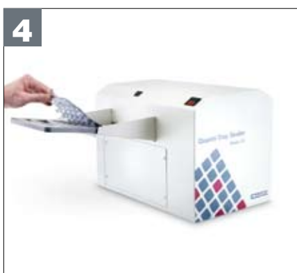
4 Fermer hermétiquement le plateau et laisser incuber