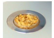
Instrument simple pour la mesure de l'aw LabStart-aw