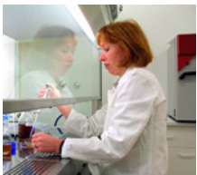
Recherche fondamentale / Instituts de recherche