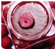
Industrie agroalimentaire / industrie des boissons